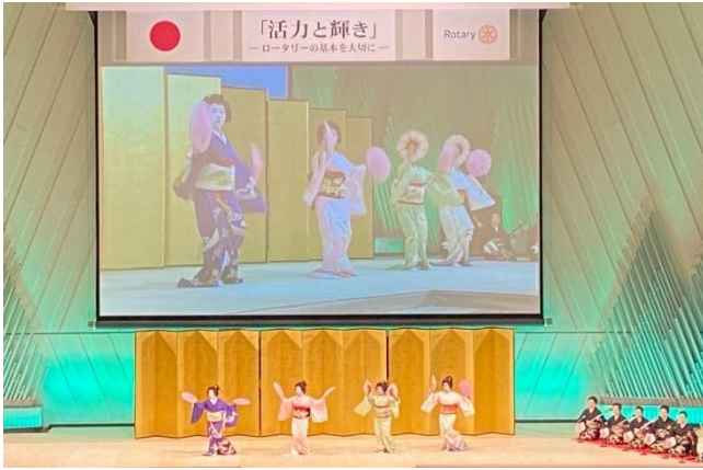
祇園甲部歌舞会による京舞