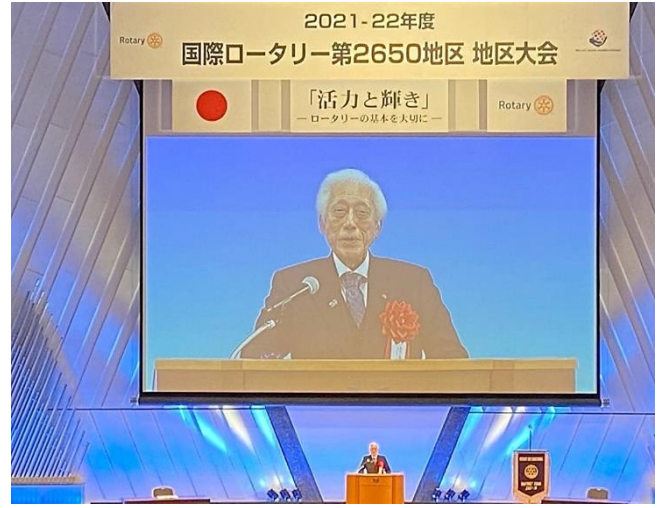
特別講和 元国際ロータリー理事 千 玄室氏