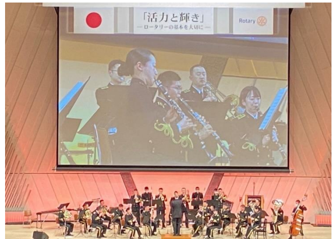
海上自衛隊 舞鶴音楽隊