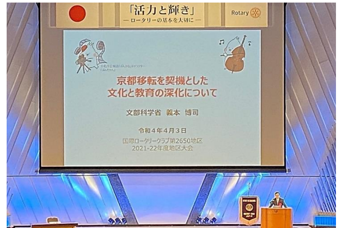
記念講演 文科省事務次官 義本博司氏