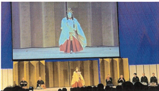
歓迎公演：金剛流 半能「右近」