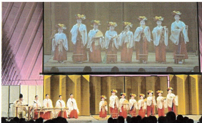
歓迎公演：北野天満宮 八乙女舞