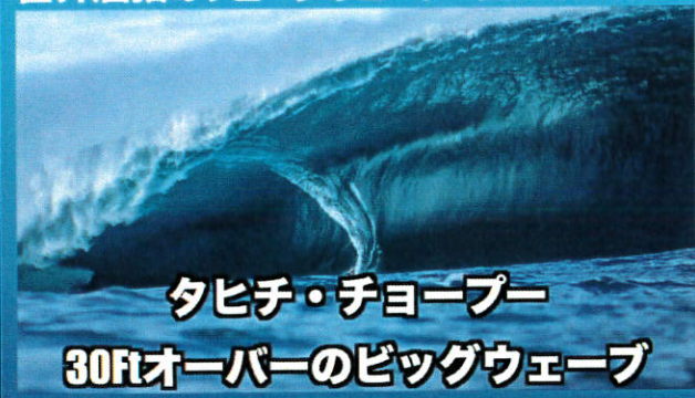
タヒチ・チョープー 30ftオーバーのビッグウェーブ