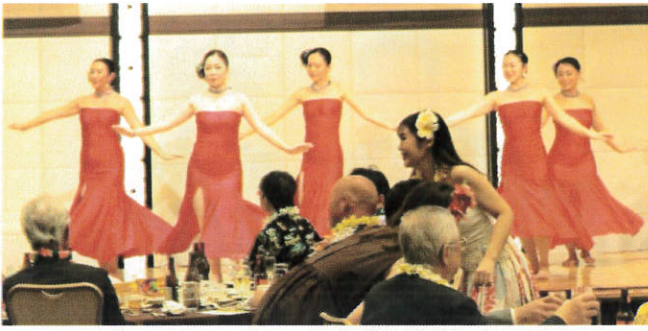
・4月25日(火)～26日(水) 福島県郡山安積RCを訪問、夜間合同例会を開催