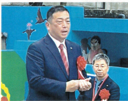
榎原市長 亀田忠彦様