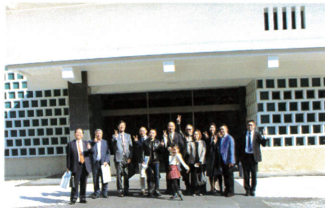
～東大寺大仏殿 登壇参拝～