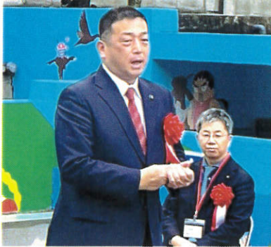
橿原市長 亀田忠彦様