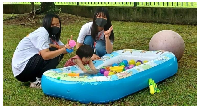
～こどもたちとの遊戯～