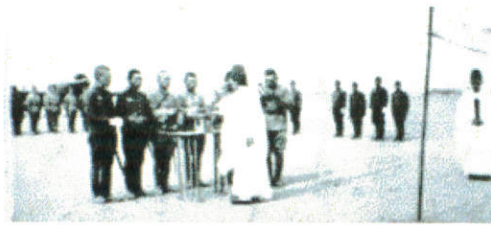
←出陣式 3月20日 前橋飛行場