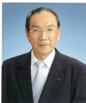
【松原六郎ガバナー】