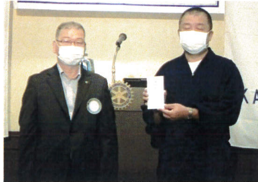
△今年度、同好会補助金の贈呈 甘樫会（ゴルフ）・書道同好会・野球同好会・ 和飲会（酒・ワイン）・軽音同好会

△2020-21 年度クラブ活動の概況及び活動計画、週報 保存用ファイルをメール BOX にポスティングして いるのでご確認頂きたい。なお、週報保存用ファ イルは週報を紙で受け取っている方のみポスティ ングしている。また、会員名簿は次週配布させて 頂く。 △「2020-21 年度前期会費等納入のお願い」もメール BOX にポスティングしている。納入は7月末日ま でにお願いしたい。