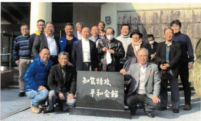
～知覧平和公園／知覧特攻平和会館～