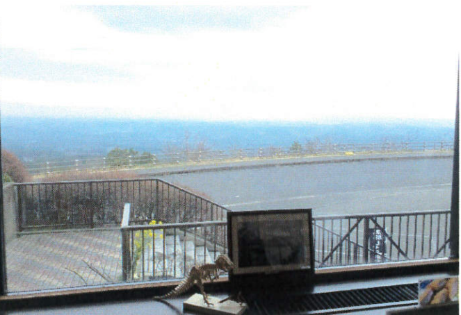
～道の駅霧島 天空のレストラン～