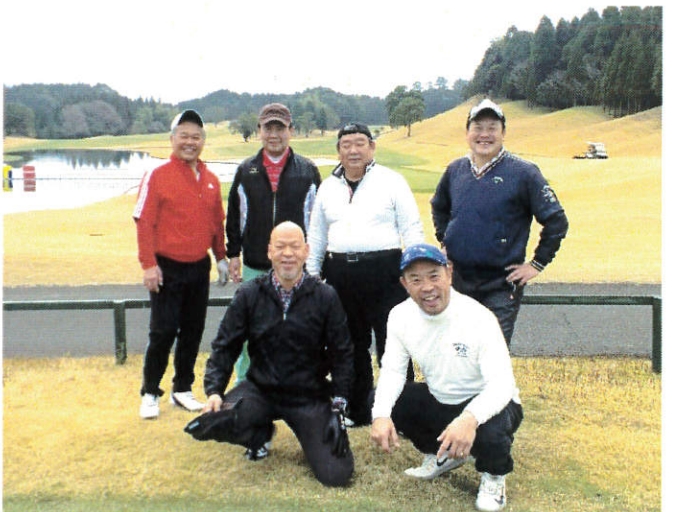
～2日目 ゴルフ組 鹿兒島高牧カントリークラブ～