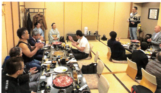
～1日目 昼食会場「黒豚料理あぢもり」～