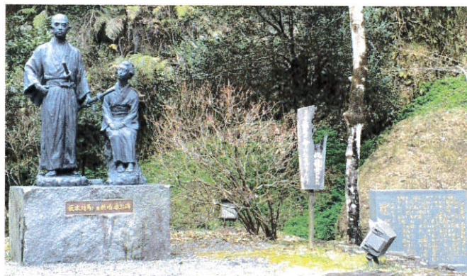
～塩浸温泉龍馬公園～

四つのテスト ①真実かどうか ②みんなに公平か ③好意と友情を深めるか ④みんなのためになるかどうか