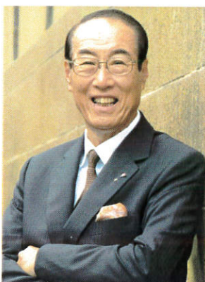
【佐竹力總ガバナー】