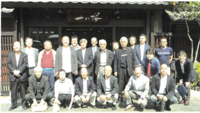
～かがみほら航空宇宙博物館 見学～